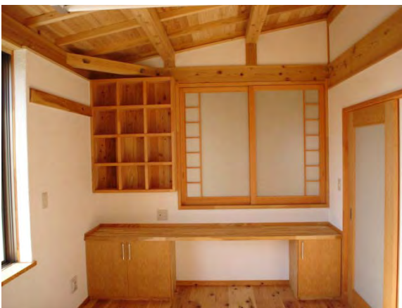
寝室：書斎コーナーのロングテーブルと飾り本棚