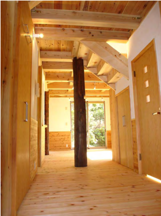
玄関ホール：中央には古材の太柱。リビング、キッチン、洗面所、トイレ、客間、階段に直接アクセスします。