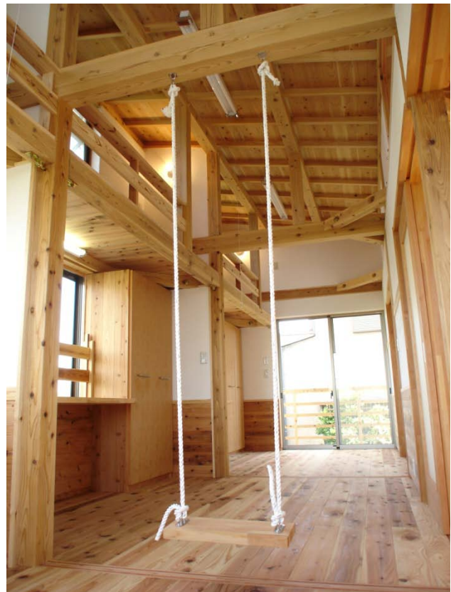
子供室：3室それぞれにデスク、クローク、ロフトベットを設置。ブランコも付けました。

玄関ホールからトンネル！を抜けると明るく開放的なリビングがあらわれる。階段、客間、洗面、トイレ、浴室すべてがリビングと直接アクセスするプランにしました。2階の子供部屋は後で仕切れるように敷居が埋め込まれています。ロフトのベットと勉強机、クロークをそれぞれに設置。小屋裏まで吹き抜けた開放的な空間にはブランコも。寝室のロングデスクも使いやすいかな。小さいなお子さんが3人いるのでリビング廻りには小物収納を充実させました。明るく風通しのよい気持ちのいい空間と遊び心のある木の家です。