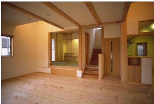
居間 2箇所の吹抜けで2階の個室とつながる 奥の和室の下は半地下の車庫