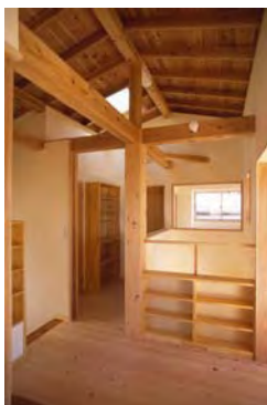
2階ホール 本棚を兼ねた手摺