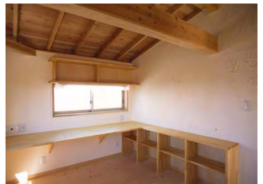
書斎 壁の漆喰塗りは建主さんの施工、右の壁には記念の手形も